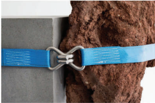
Detalle de la pieza "The Act of Perseverance" © Agustín Arce

Este entramado de piezas en equilibrio es matizado con elementos a través de los cuales se visibilizan de forma poética las propiedades de la materia. Otra escultura de la muestra, Every Finding Has a Consequence , es coronada por una manzana roja. El creador lo explica de esta forma: “Hay elementos simbólicos que generar otras lecturas. La manzana, por ejemplo, tiene que ver con la gravedad y lo científico, pero también con la religión y las tentaciones”. Sobre el globo rojo, que convive en medio de la pesadez de las vigas, Dávila comenta que “alude a lo infantil, lo romántico y lo naive (lo opuesto a lo racional). El globo, por otro lado, siempre va en contra de la fuerza de gravedad, aunque parezca frágil tiene toda la fuerza para trabajar en un sentido opuesto y elevarse en lugar de caer, debido al helio que contiene”.