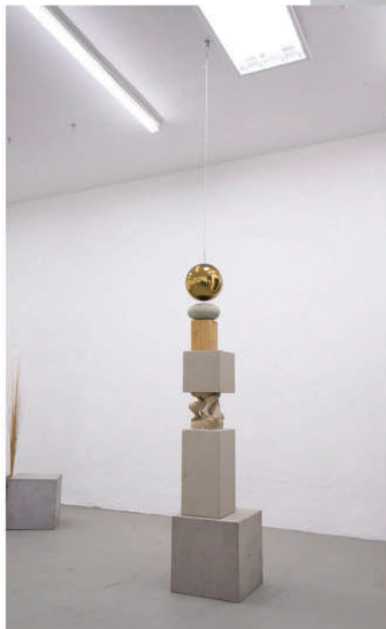
Imagen de la pieza 'Panopticon', que se encuentra en la segunda parte de la muestra, en la