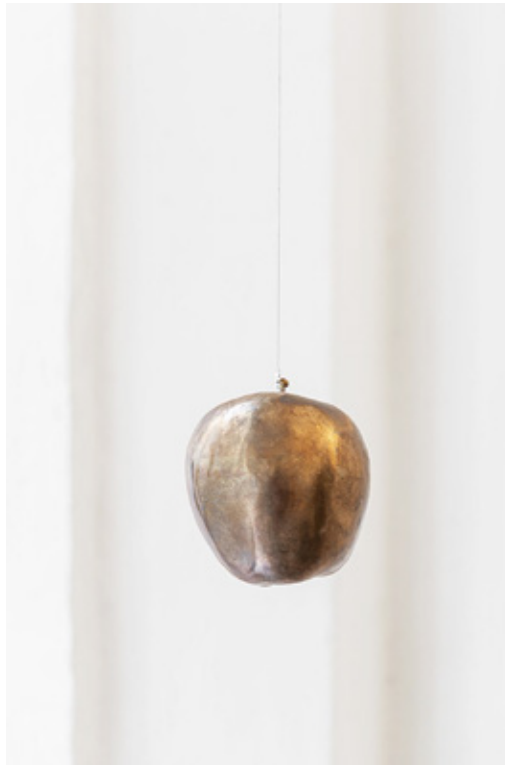
Jose Dávila. La fábula de la mela . Exhibition view at BASE, Firenze 2021.

Jose Dávila (Guadalajara, 1974) ha studiato architettura presso l'Istituto Tecnológico y de Estudios Superiores de Occidente. L'arte di Dávila esplora l'occupazione spaziale e la natura transitoria delle strutture fisiche, riuscendo a creare installazioni scultoree e opere fotografiche che allo stesso tempo emulano, criticano e rendono omaggio all'arte e all'architettura d'avanguardia del XX secolo. Le opere di Dávila si trovano nelle collezioni permanenti di numerose istituzioni internazionali, tra cui il Museo Nacional Centro de Arte Reina Sofía di Madrid e l'Albright-Knox Museum di Buffalo.