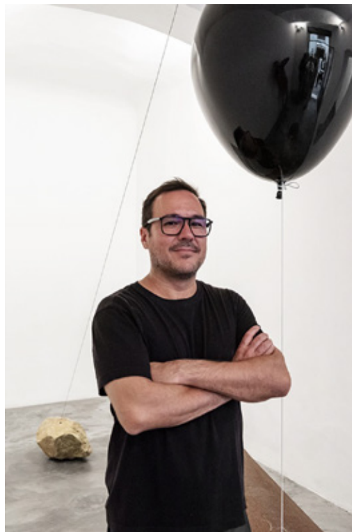
Jose Dávila. La favola della mela. Exhibition view at BASE, Firenze 2021.

“La favola della mela è un simbolo perfetto di come funzionano i sistemi di comunicazione, tra cui la scienza e l'arte. Sistemi che hanno la capacità di agire come veicoli narrativi per introdurre concetti astratti nel regno del quotidiano. Le sculture, all'interno di questa mostra, possono essere viste, al pari di gesti intermedi, a metà tra la distruzione incombente e la permanenza immutabile. È la messa in scena di un istante che si espande all'infinito. In parte è una critica al presente espanso dell'oggi tecnologico, dove tutto sembra che avvenga solo qui e ora, ma anche un modo per riflettere sul nostro passato, sul modo di ricordare e di conseguenza sulle modalità di costruzione del nostro futuro”. Jose Dávila descrive così la sua nuova mostra allestita presso Base/Progetti per l'arte a Firenze – spazio indipendente ideato da un collettivo di artisti che vivono in Toscana.